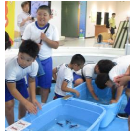
川の生き物にワクワク