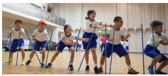
チャレンジ・ザ・ゲームの棒取りに挑戦!

家族から離れ、初めて子どもだけで宿泊するという児童もいましたが、友達と支え合い協力しながら、充実した2日間を過ごすことができ、とてもたくましくなって帰ってきました。宿泊研修で学んだことや経験したことを、これからの生活でしっかり活かしてほしいと思います。