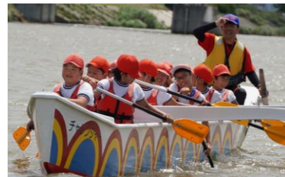
力を合わせて漕ぎました!