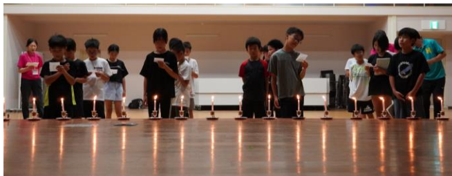
ろうそくの炎を見つめながら、歌を歌いました。